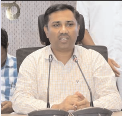
తీసుకుంటామని హెచ్చరించారు. రైతు రిజిస్ట్రీని నిర్దేశిత లక్ష్యాలకు అనుగుణంగా పూర్తి చేయాలని సూచిస్తూ, ప్రతి ఏకావో రోజుకు 20 రైతు రిజిస్ట్రీలు, ప్రతి ఎంపీవో 30 రైతు రిజిస్ట్రీలు పూర్తి చేయాలని ఆదేశించారు. పట్టణ ప్రాంతాల్లో విలీనమైన గ్రామాల్లో రైతు రిజిస్ట్రీ ప్రక్రియను ప్రణాళికాబద్ధంగా పూర్తి చేయాలని కలెక్టర్ సూచించారు. సాగు ప్రారంభానికి ముందే రైతు రిజిస్ట్రీ పూర్తి కావాలని స్పష్టం చేశారు. భవిష్యత్తులో రైతు రిజిస్ట్రీ ఆధారంగానే అవసరమైన విత్తనాలు, ఎరువుల సరఫరా నిర్వహించబడుతుందని తెలిపారు. ఆయల్ పామ్ సాగును మరింత విస్తరించేందుకు ప్రత్యేక దృష్టి సారించాలని కలెక్టర్ ఆదేశించారు. వ్యవసాయ, ఉద్యాన వన శాఖలు సమన్వయంతో పనిచేస్తూ ఆయల్ పామ్ సాగు లక్ష్యాలను సాధించేందుకు ప్రత్యేక కార్యాచరణ ప్రణాళిక రూపొందించాలని సూచించారు. ఈ సమావేశంలో జిల్లా వ్యవసాయ శాఖ అధికారి డి.పుల్లయ్య, వ్యవసాయ, పోలీస్, సంబంధిత శాఖల అధికారులు, తదితరులు పాల్గొన్నారు.

లైసెన్స్ పొందిన విత్తన షాపుల నుంచే విత్తనాలు కొనుగోలు చేయాలని సూచించారు. కొంతమంది వ్యక్తులు గ్రామాల్లో తిరుగుతూ రైతులను మభ్యపెట్టి నకిలీ విత్తనాలను విక్రయించే ప్రయత్నాలు చేస్తున్నారని, అలాంటి మోసాలను అరికట్టేందుకు రైతుల్లో విస్తృత అవగాహన కల్పించాల్సిన అవసరం ఉందన్నారు. ప్రతి రైతు వేదిక సమావేశంలో వ్యవసాయ విస్తరణ అధికారులు పాల్గొని గ్రామ స్థాయిలో రైతులకు అవగాహన కార్యక్రమాలు నిర్వహించాలని సూచించారు. మండల స్థాయి టాస్క్ ఫోర్స్ బృందాలు చేపట్టిన చర్యల అనంతరం క్రమం తప్పకుండా మీడియా సమావేశాలు నిర్వహించాలని కలెక్టర్ ఆదేశించారు. నకిలీ విత్తనాలపై సమాచారం అందించేందుకు జిల్లా స్థాయిలో కంట్రోల్ రూమ్ ఏర్పాటు చేసి ప్రత్యేక ఫోన్ నంబర్ను అందుబాటులో ఉంచాలని తెలిపారు. రైతులను అప్రమత్తం చేయడంలో అవగాహన కార్యక్రమాలు కీలకమని కలెక్టర్ పేర్కొన్నారు. ఏకావోలు క్షేత్ర స్థాయిలో పర్యటిస్తూ వంద శాతం క్రాప్ బుకింగ్ పూర్తి చేయాలని కలెక్టర్ ఆదేశించారు. విధుల్లో నిరక్ష వహించే వారిపై చర్యలు