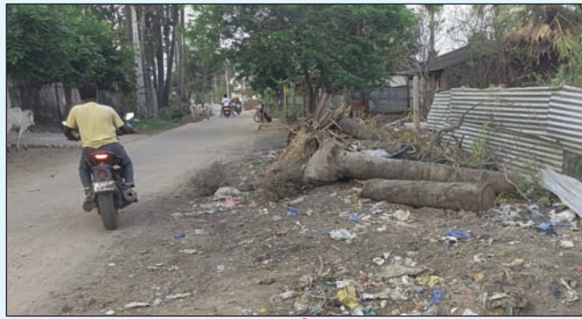
- ఎవరిదారి ... వారిదే