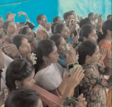
సభ్యులు, తదితరులు పాల్గొన్నారు.