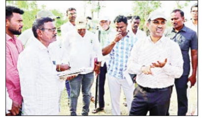
కోఆర్డినేట్లతో సహా ఖచ్చితంగా నమోదు